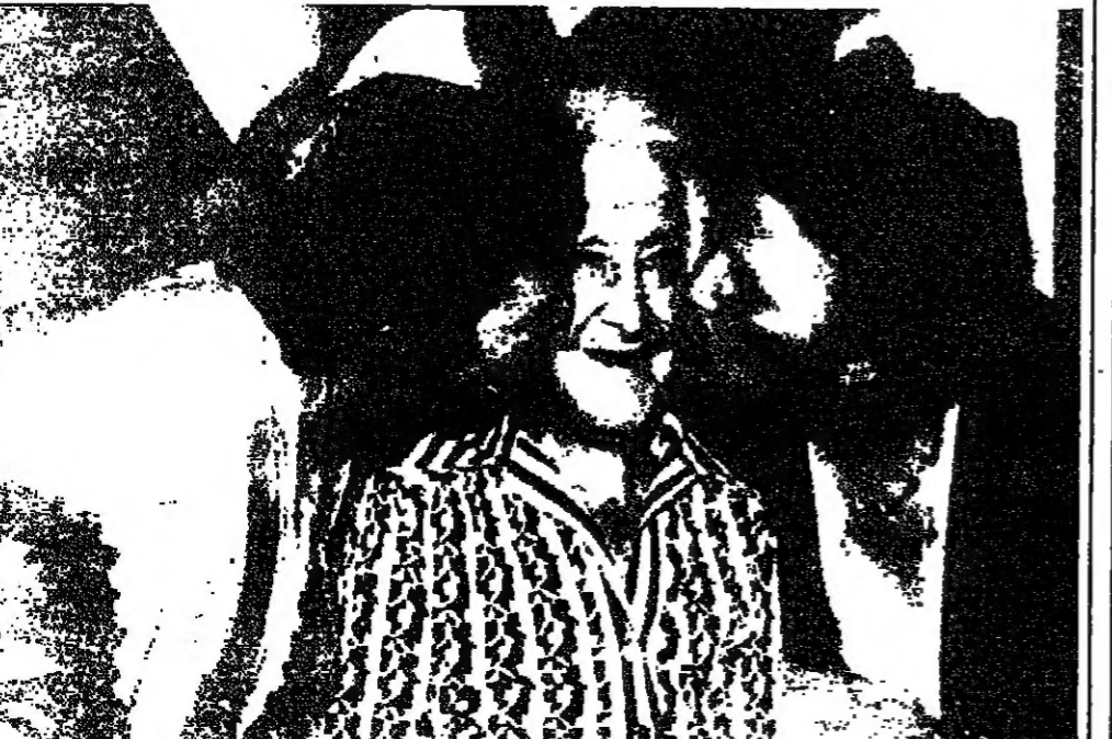
بعيها الرابع عشر بعد المئة وتبدو جان هنا وهي ثقيل التهيئي والتمنيتات.